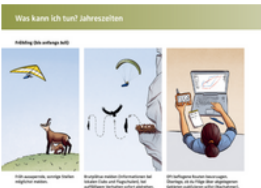
Leseprobe aus dem Handout "Hängegleiten und Wildtiere" des Schweizerischen Hängegleiter Verbands (SHV).