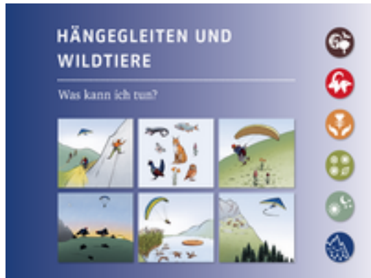
Titelseite des Handouts "Hängegleiten und Wildtiere" des Schweizerischen Hängegleiter Verbands (SHV).