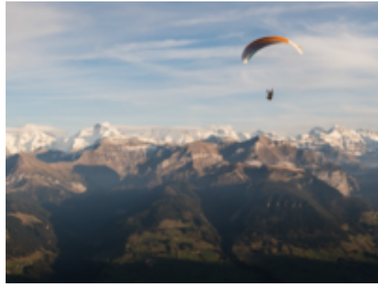
Das Berner Oberland ist ein beliebtes Ausflugsziel für verschiedene Freizeitsportler. Im Bild ein Gleitschirm vor Kulisse der Berner Alpen.